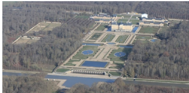
Château de Vaux-le-Vicomte