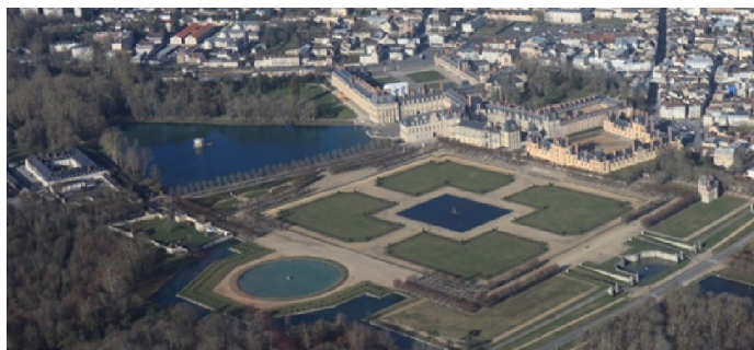
Château de Fontainebleau

Un kilomètre de route ne mène nulle part. Un kilomètre de piste peut vous emmener partout !